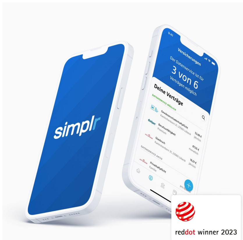
Die Kunden-App simplr von blau direkt ausgezeichnet mit dem Red Dot Award

Nachdem die blau direkt Endkunden-App allein in diesem Jahr mehrfach für ihre Produktqualität und ihre Benutzerfreundlichkeit ausgezeichnet wurde, konnte simplr nun auch die internationale Jury des Red Dot Awards überzeugen und erhält für ihr Produktdesign die Auszeichnung "Red Dot: Brands & Communication Design 2023" . Somit gehört simplr zu den besten Marken und Kommunikationsdesigns 2023. Eine 24-köpfige Jury bewertete die 9.000 Einreichungen, die von Brands aus 39 Branchen und 56 Ländern eingereicht wurden. In der Kategorie App stach simplr mit seinem Gesamtkonzept von der Idee bis zur Umsetzung hervor und wurde unter anderem für die Kriterien: Innovation, Originalität, Kreativität, Gestaltungsqualität und Verständlichkeit ausgezeichnet.